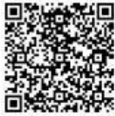
防空演習或空襲時的警報音符圖示