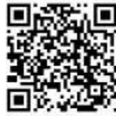
防空演習或空襲時聽到的緊急警報聲音